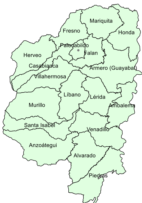
Mapa 1. Municipios de la Región Norte del Tolima.